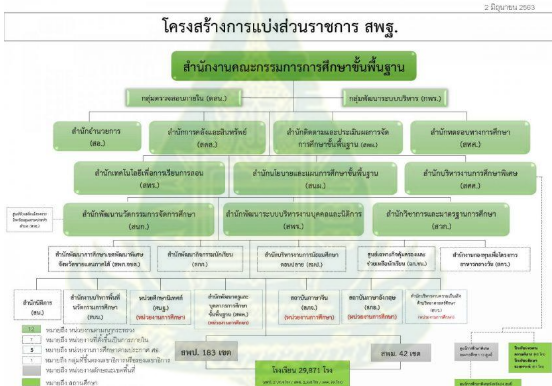
ภาพที่ 2 โครงสร้างการแบ่งส่วนราชการ สพฐ. 431

เมื่อศึกษาโครงสร้างการบริหารจัดการสถานศึกษาขั้นพื้นฐานของประเทศไทยจากการทบทวนวรรณกรรมและการสัมภาษณ์เชิงลึกกลุ่มผู้ปฏิบัติงานในโรงเรียนหรือสถานศึกษา พบว่า สถานศึกษาขั้นพื้นฐานของไทยมีการกำกับดูแลโดยสำนักงานคณะกรรมการการศึกษาขั้นพื้นฐาน (สพฐ.) ซึ่งเป็นส่วนราชการส่วนหนึ่งภายใต้กระทรวงศึกษาธิการ สำนักงานคณะกรรมการการศึกษาขั้นพื้นฐานมีโครงสร้างองค์กรเป็นปัจจุบันมีสำนักงานเขตพื้นที่ (สพท.) ทั่วประเทศรวมจำนวน 225 เขต แบ่งเป็นสำนักงานเขตพื้นที่การศึกษามัธยมศึกษา (สพม.) 42 เขต และสำนักงานเขตพื้นที่การศึกษาประถมศึกษา (สพป.) 183 เขต